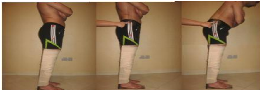
شکل ۲. نحوه ارزیابی حس عمقی ناحیه کمری- لگن

سعی کند این وضعیت را به خاطر بسپارد (در این مرحله با تحریک صوتی خاتمه حرکت به اطلاع آزمودنی رسانیده می شد)، سپس باز به آرامی به وضعیت اولیه باز می گشت و پس از مکث پنج ثانیه ای حرکت بعدی را شروع می کرد. بعد از سه بار تکرار (جهت یادگیری) در مرحله آزمون فرد باید وضعیت ۳۰ درجه خم شده را (بدون وجود تحریک صوتی) بازسازی می کرد. این آزمون سه بار تکرار می شد و میزان خطاهای وی بر حسب درجه ثبت می شد، عدد میزان خطا در هر حرکت تفاضل زوایای مذکور از زاویه هدف بود، سپس میانگین مقدار خطا در بازسازی وضعیت در سه بار تکرار به عنوان میزان خطای بازسازی وضعیت ثبت گردید و در صورتی که میانگین مقدار خطا کمتر از سه درجه بود، حس عمقی کمر آزمودنی سالم تلقی می شد (۱۵) (شکل ۲).