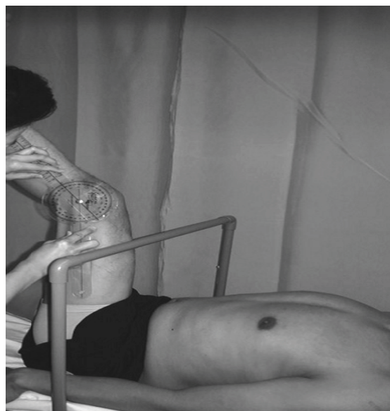
شکل ۱. اندازه‌گیری دامنه حرکتی اکستنشن اکتیو زانو