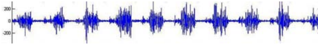
شکل ۲. نمونه‌ای از سیگنال خام عضله دلتوئید میانی طی اجرای حرکات آبداکشن (در واحد میکرو ولت)