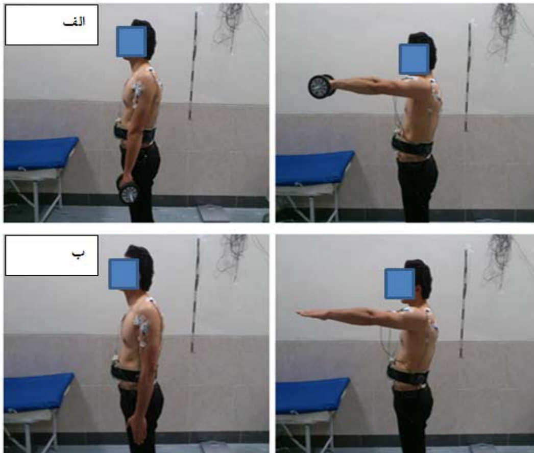
شکل ۱. موقعیت ابتدایی و انتهایی وظایف حرکتی شامل اجرای فلکشن بازو با (الف) و بدون بار (ب)

وزن بدن و بدون بار انجام دادند. هر کدام از این آزمون‌ها، ۵ بار تکرار شد. بین هر تکرار به آزمودنی‌ها ۱۵ ثانیه استراحت داده شد تا عضلات دچار خستگی نشوند. وظایف حرکتی در شکل ۱ آورده شده است. قبل از شروع تست‌گیری آزمودنی‌ها حدود ۱۰ دقیقه فعالیت گرم کردن عمومی شامل حرکات کششی و نرمش شانه انجام دادند. سپس آزمودنی برای اجرای حرکات در فضای کالیبره شده قرار گرفت تا با هدایت آزمون‌گر و مترونوم (جهت کنترل سرعت حرکات افراد) آزمون‌های مورد نظر را اجرا نمایند.