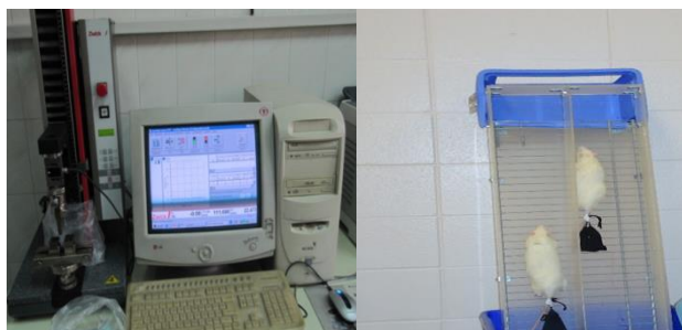
شکل ۲. (الف). دستگاه تست نیروی خمشی سه نقطه‌ای (ب). نردبان مخصوص تمرین قدرتی موش‌ها

در این تحقیق تجربی، ۱۶ رأس موش صحرایی نر، ۲۰ ماهه، نژاد ویستار و سالم، پس از یک هفته دوره آشنایی با محیط و زندگی در شرایط آزمایشگاهی به روش تصادفی به دو گروه تمرین مقاومتی ( n=8 ) و کنترل ( n=8 ) تقسیم شدند. موش‌های گروه کنترل و تجربی در محیطی با میانگین دمای 1/4 \pm 22 درجه سانتی‌گراد، رطوبت 4 \pm 55 و چرخه روشنایی-تاریکی ۱۲:۱۲ ساعت در قفس‌های مخصوص از جنس پلی کربنات نگهداری شدند. در هفته دوم موش‌ها به‌منظور آشناسازی با