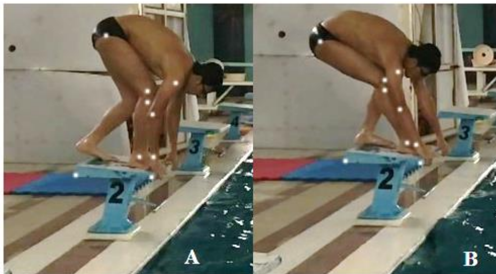
شکل ۲. A نحوه اجرای استارت تک‌پای جلو وزن، B نحوه اجرای استارت تک‌پای عقب وزن.

سر رو به پایین و نزدیک به پای جلو قرار می‌گیرد (شکل ۲). هر شناگر می‌تواند سه بار به اجرای دو تکنیک استارت جلو وزن و عقب وزن مبادرت نماید تا اجرای برتر او ثبت گردد. با شروع آزمون و با شنیدن فرمان رو، شناگر خود را به دورترین نقطه از سکوی استارت پرتاب می‌کند و نسبت به اجرای مهارت استارت مبادرت نماید. تعداد آزمودنی‌ها ۱۴ نفر بود که به دو گروه هفت نفره تقسیم شدند. ابتدا هفت نفر اول اقدام به استارت تک‌پای جلو وزن نمودند، سپس هفت نفر دیگر