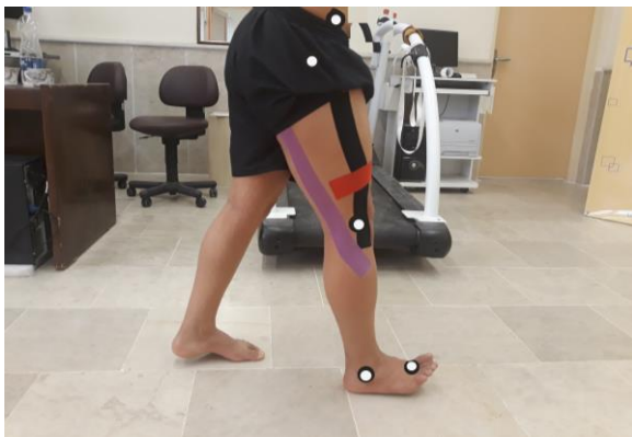
شکل ۱. محل قرارگیری مارکر و نحوه تیپینگ

متغیرهای افراد شرکت‌کننده از لحظه برخورد پاشنه تا بلند شدن انگشت شست از صفر تا صد درصد نرمالیز گردید. از نوار کنزیوتیپ ساخت کشور کره جنوبی بر روی گروه تیپینگ استفاده شد. سه نوار کنزیوتیپ ۵ سانتی متری بر روی عضلات دوسررانی (بنفش)، کشنده پهن نیام (سیاه) و عضلات چهارسررانی (قرمز) به روش اصلاح مکانیکی نواربندی شد. ابتداءً آن را در حالت ۴۵ درجه فلکشن و ۳۰ درجه آبداکشن و چرخش داخلی قرار داده سپس عضله دوسررانی را از برجستگی ورک تا سر پروگزیمال استخوان نازک‌نی تیپ شد. در انتهای حرکت زانو از حالت ۴۵ درجه فلکشن به اکستنشن کامل تغییر پیدا می‌کند و عضله‌ی کشنده پهن نیام از بخش قدامی تاج خاصره تا برجستگی خارجی استخوان درشت‌نی تیپ شد. میزان کشش نوار کنزیوتیپ در عضلات دوسررانی و کشنده پهن نیام ۶۰ درصد بود (۲۳، ۲۴).