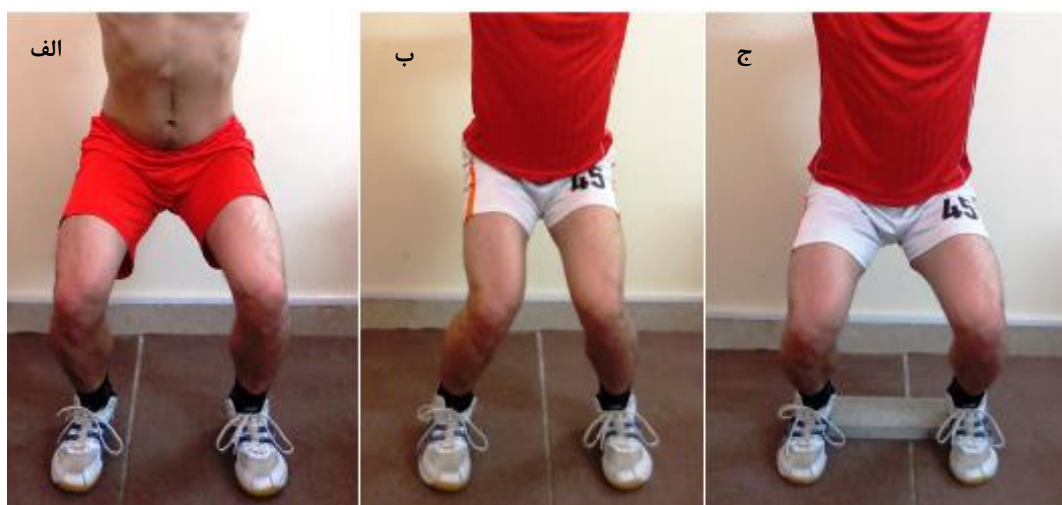
شکل ۱. الف: عدم والگوس زانو حین اسکات، ب: والگوس مشهود زانو حین اسکات، ج: اصلاح والگوس حین اسکات با بالا بردن پاشنه

آزمودنی‌ها و روش انتخاب: پس از غربالگری والگوس پویای زانو از میان ۹۷ بسکتبالیست داوطلب، ۱۸ نفر واجد شرایط و بدون والگوس برای گروه کنترل و ۱۷ نفر واجد شرایط و دارای جابجایی داخلی بیش از حد زانو به عنوان گروه دارای والگوس پویای زانو انتخاب شدند. بر اساس تعریف عملیاتی بسکتبالیست‌هایی دارای والگوس پویای زانو محسوب شدند که در طی اسکات جفت پا راستای نقطه میانی استخوان کشکک از بخش داخلی شست پا عبور کند (۱۸). گروه کنترل شامل بسکتبالیست‌هایی بود که در طول اسکات والگوس پویای زانو نداشته باشند و زانو به طور مستقیم در راستای انگشتان پای قرار بگیرد. علاوه بر این، آزمودنی‌ها بین ۱۸ تا ۲۵ سال بودند و سابقه عمل جراحی و آسیب اندام تحتانی در طی یک سال گذشته نداشتند. همه آزمون‌ها در آزمایشگاه پژوهشی تربیت بدنی دانشگاه گیلان انجام شد. پیش از آزمون، بسکتبالیست‌ها فرم رضایت‌نامه را امضا نموده و سپس در آزمون غربالگری ارزیابی اسکات جفت پا (بالای سر) شرکت نمودند. آزمون اسکات بالای سر (۱۹) به منظور شناسایی بسکتبالیست‌های دارای والگوس پویای زانو و افراد فاقد والگوس پویای زانو انجام شد. هر شرکت‌کننده مجموعه‌ای اسکات دو پا (۵ تکرار) در وضعیت استاندارد را انجام داد که وضعیت پاها هم عرض شانه‌ها، انگشتان پا رو به جلو، و