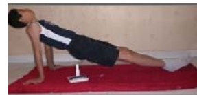
پل زدن طاقباز روی پاشنه