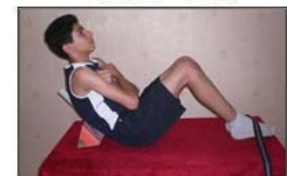
تحمل فلکسوری الف