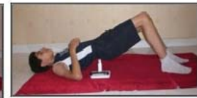
پل زدن طاقباز