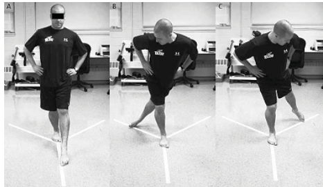
شکل ۱. روش ارزیابی تعادل پویا و ایستا روش اجرای آزمون Y (سمت راست) روش اجرای آزمون باس استیک (سمت چپ)